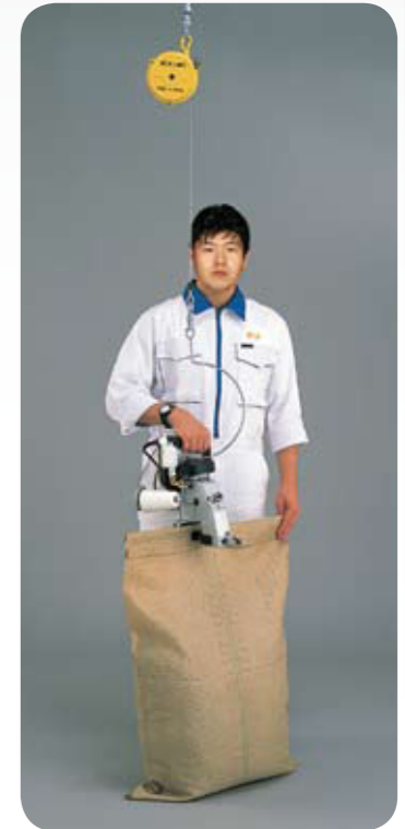
使用平衡器吊钩方式